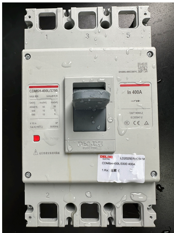
1# Ka: 盐雾 (类别A)