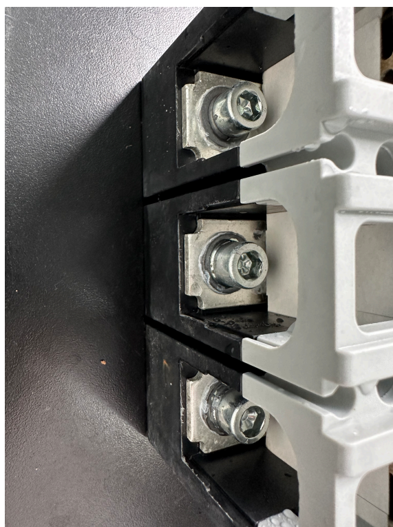
1# Ka: 盐雾 (类别A)